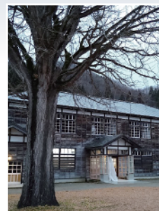
▲喰丸小と大イチョウ