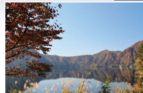
▲沼沢湖 西会津国際芸術村