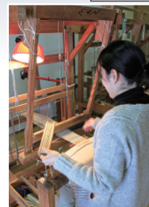
▲からむし織り体験