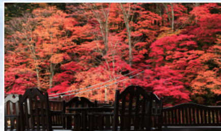
▲塩原赤吊橋の紅葉